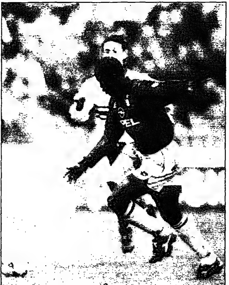
جورج ويه واهد هدايا لليون خلال مباراة فريقه مع سامبدوريا